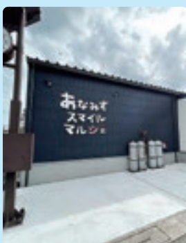
10月6日オープンの仮設商店街「あなみずスマイルマルシェ」

今後、全国の商工会とともに、被災地への支援活動を継続し、能登地域の復興を後押ししてまいります。