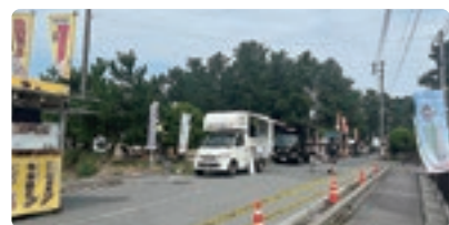
出店されたキッチンカーの様子

昨年のサイクルカーニバル記念大会時に初めて開催したマルシェを、好評につき今年も開催しました。昨年は難しかったキッチンカーの設置も可能となり、出店数は合計46店舗、来場者数は約2,500人でした。飲食だけでなく、雑貨や体験ブースの店舗も出店し、スタートより多くの来場客で賑わいました。