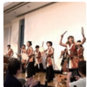
迫力の伝統太鼓に沸く会場