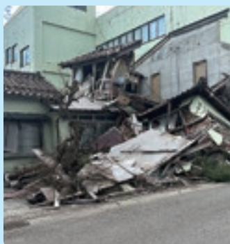
建物が一部倒壊した事業所

穴水町内の中心エリア周辺では建物が取り壊されたとみられる更地が多く、大きな被害を受けた建物の撤去は徐々に進んでいるものの、傾いた建物や崩れ落ちた建物の瓦礫が散見され、町の復旧、事業の再建には相應の時間を要するため、継続的な支援が求められています。