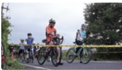
スタート地点の様子

また、地元女性会の協力で5年ぶりに炊き出しを実施することができ、食事の時間が一緒に参加した仲間や家族での談笑の時間となっていた様子が伺えました。