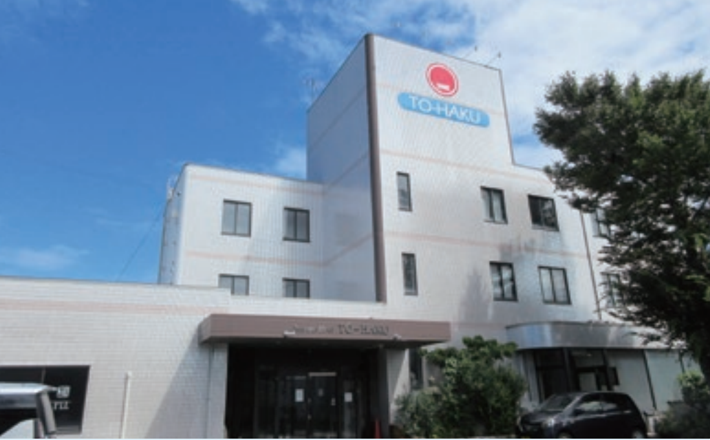
日本海が一望でき、潮風の心地よいホテルです