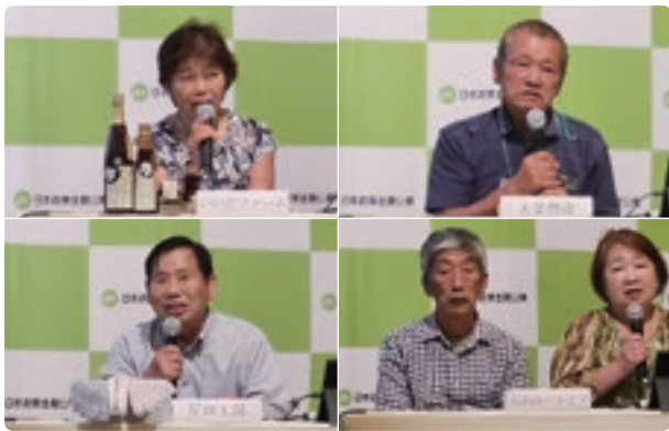
左上から「いいたファーム」さん、「大栄農産」さん、左下から「岸田工房」さん、「大山ユートピア」さん

県内の4事業者が登壇され「いいたファーム(北栄町)」「大栄農産(北栄町)」「岸田工房(鳥取市南)」「大山ユートピア(大山町)」と、全てが商工会地域の事業所となりました。視聴申込者は全国から170名を超え、非常に多くの方にご参加いただくことが出来ました。