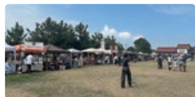
マルシェ会場の様子