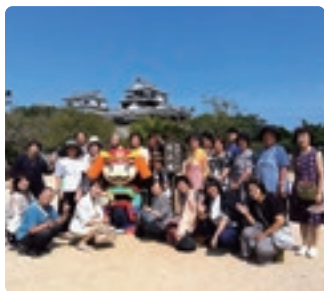
快晴のなか松山城を背に

2日間ともに天気に恵まれ、充実した交流会となりました。次年度は岡山県での開催です。皆様のご参加をお待ちしております。