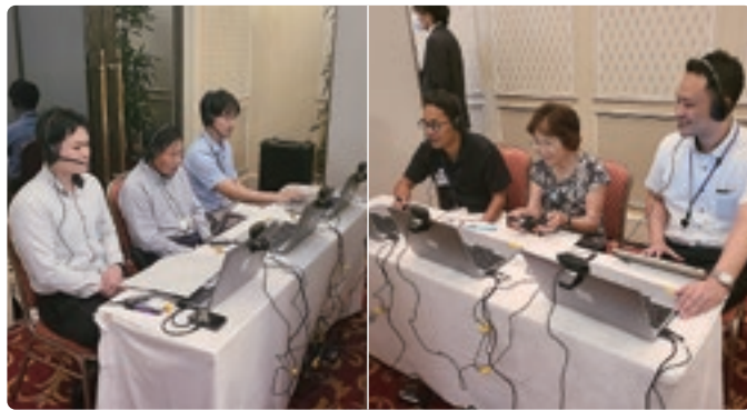
WEBによる承継希望先との交流会

事業者がPRを行ったのち、視聴者からの質問に答えていく方式で行われ、視聴者の疑問を解きながら自身の事業に対する熱い思いを伝えていました。