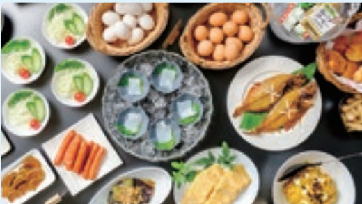
栄養満点の手作り朝食バイキングが大好評