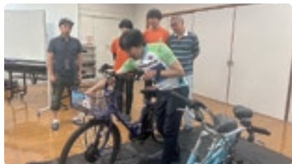
ガイド養成講座の様子

研修会では、各参加者が地域資源や店舗を巡る「地域に消費が生まれるツアー」の作成を行いました。秋には各グループで選定したツアーを巡る実技講習を10・11月に予定しており、参加者の事業化に向けた人材育成ツアーの商品化が大いに期待されます。