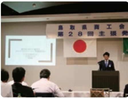
活用した青年部長による事例紹介

主張発表大会と同日に開催した令和6年度第2回資質向上研修会では、「ビジネスコミュニケーション型補助金の活用について」と題し、商工会青年部が有効活用できる同補助金の活用を促進する研修会を開催しました。