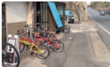
多くのサイクリストが立ち寄るカフェ

具体的には、鳥取県各市町村と連携を図り、国内外から各エリアを訪れるサイクリストの需要を捉えた、地域ならではの観光コンテンツや新たなビジネスの創出について継続的に個社支援を実施し、既存事業者の経営改善・革新、創業・事業承継等に繋がっていきます。