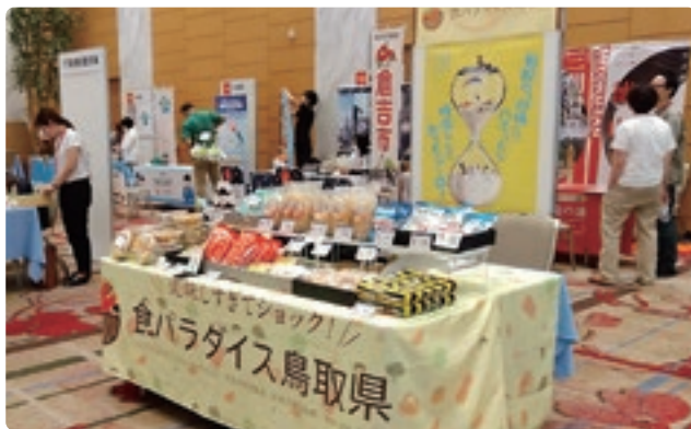
厳選された商品が並べられた物産ブース

県連合会からは、創業支援の一環として起業相談ブースを出展し、将来、鳥取で起業に挑戦してみたいという希望者の相談対応を行いました。