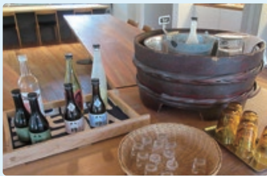
落ち着いた店内の中央に並ぶ地酒「八郷（やごう）」