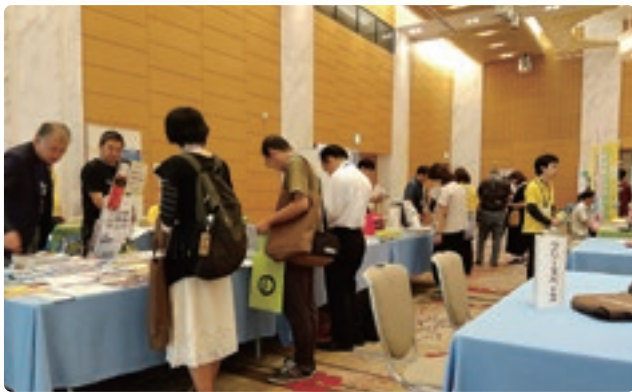
各行政・関係団体の情報を網羅した資料コーナー 鳥取の情報を求める多くの人で賑わいました

1日の来場者数は48組67名のほり、鳥取で就職を考えている若者や、定年後に鳥取への移住を検討しているご夫婦など、多くの人で賑わいました。