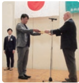
部員増強について表彰状を授与

上に向けた事業を実施し、外部に発信することで、人材育成、地域経済の発展に寄与していきます。