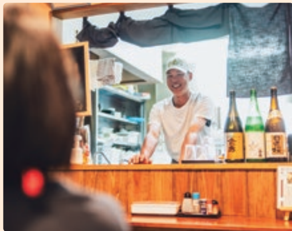
取材中にリラックスして談笑

昔から言われたことをやるだけよりも、自分なりのやり方を工夫するのが好きだという。その好奇心や創造力で「仕事って大変だけど、料理はめんどくさいかと思ったことがない」と、のめり込んでいった。 一番人気のだし巻きは、口に入れた途端、柔らかな食感と出汁の旨みが広がる。 人が喜んでくれ、楽しい場所に 1階に最大20人、2階は宴会場で20人までの利用が可能(要予約)。アットホームな雰囲気観光客にも地元客にも受け入れられ、人気を集めている。 「昔からその場が楽しくなるのが好きなので、こつこつと自分の料理をおいしくって言った