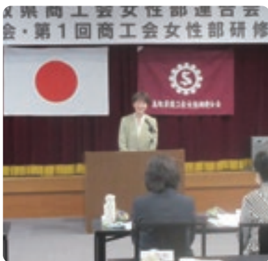
青木県女性連会長の挨拶で開会