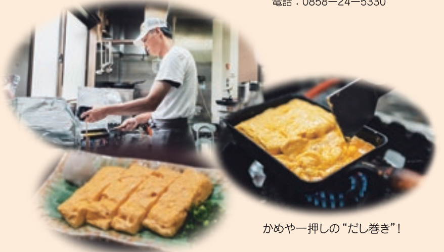
かめや一押しのだし巻き!」

昔から言われたことをやるだけよりも、自分なりのやり方を工夫するのが好きだという。その好奇心や創造力で「仕事って大変だけど、料理はめんどくさいかと思ったことがない」と、のめり込んでいった。 一番人気のだし巻きは、口に入れた途端、柔らかな食感と出汁の旨みが広がる。 人が喜んでくれ、楽しい場所に 1階に最大20人、2階は宴会場で20人までの利用が可能(要予約)。アットホームな雰囲気観光客にも地元客にも受け入れられ、人気を集めている。 「昔からその場が楽しくなるのが好きなので、こつこつと自分の料理をおいしくって言った