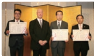
会員加入推進表彰