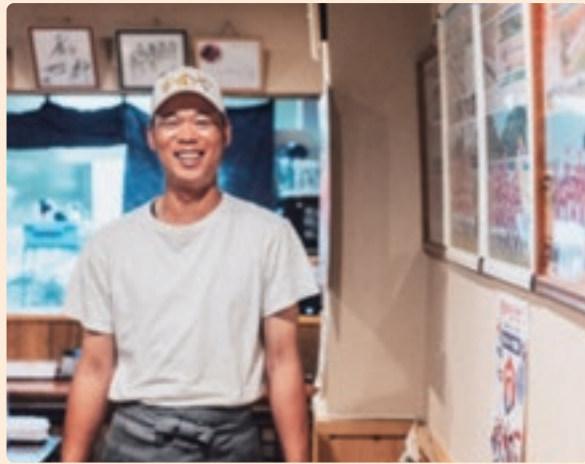
少年野球の写真で埋め尽くされた壁面

監督を引き受け、飲食業に挑戦 監督を引き受けたのが4年前。練習に行けるようにするため、勤めていた製造業の会社を退職。そのことを知った保護者仲間だった先代経営者から誘われ、最初はアルバイトから飲食業界に飛び込んだ。 「監督をやるなら本気でやりたかった。料理はたまに家族に振る舞うくらいだったけど、やってみようと。魚を捌いて刺身にしたり、煮込んでみたり、やり出したらこだわる方なんですよ」