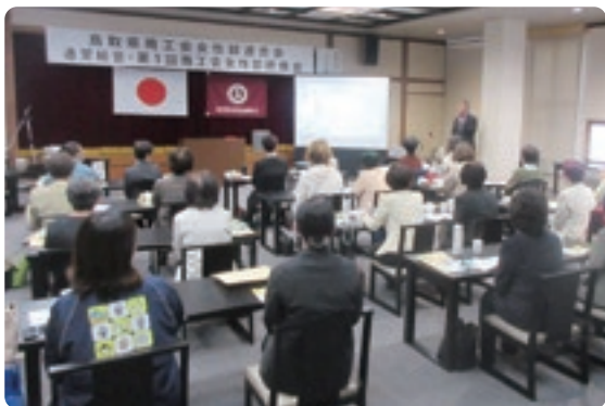
講師の話に熱心に耳を傾ける受講者

各地で自然災害が多発するなか、今後は単なる防災にとどまらず、部員事業所のBCP策定推進にも注力をしていきたいと思います。