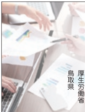
厚生労働省 鳥取県

ご多忙のことは存じますが、調査の重要性をご理解いただき、調査にご回答いただきますようお願いいたします。