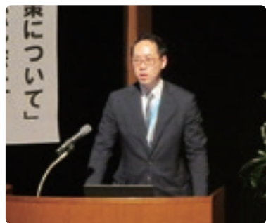
東京海上日動火災保険による講演

今後鳥取県商工会では、地域および事業者を取り巻く現状を踏まえて、事業者へ寄り添った支援ができるよう努めていきます。