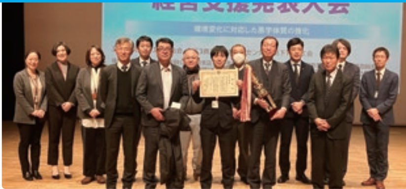
最優秀賞を受賞した中部センターと関係者

鳥取県商工会連合会と県内3商工会産業支援センター、18商工会は2月2日、倉吉未来中心で「第24回経営支援発表大会」を開催しました。会員事業者、行政、金融機関などの各関係機関を含む約140名が見守る中、3人の経営支援専門員が登壇し、「環境変化に対応した黒字体質の強化」をテーマに、事業者へ行った支援を発表しました。 大会は、「伴走型支援の成果を「見える化」すること、商工会の活動を周知することともに、経営支援の資質向上や関係機関との連携強化を図り、事業者の持続的発展につなげることを目的に開催しています。