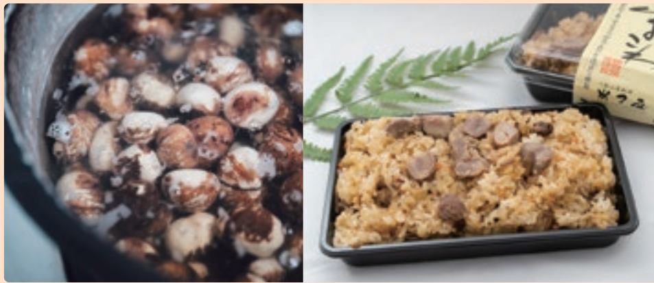
手作業で一つずつ皮を剥きしぶを取った栗