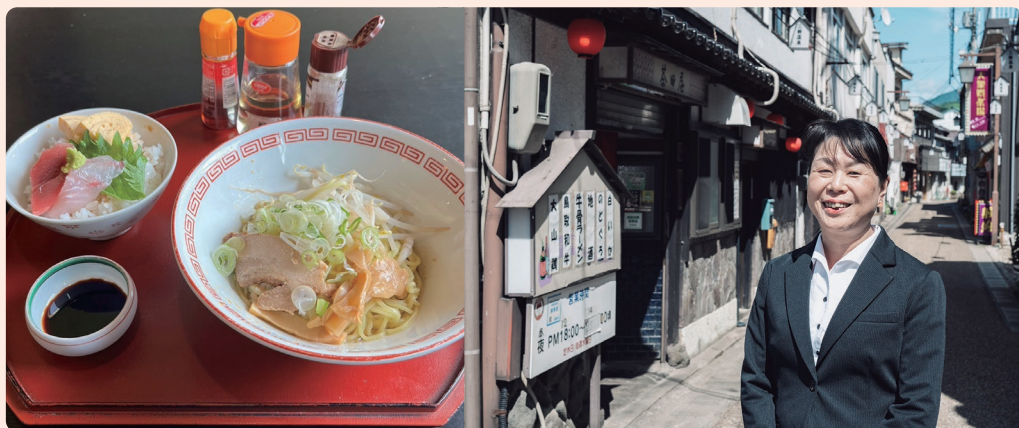
三朝名物B級グルメ「元祖みささラードン麺」