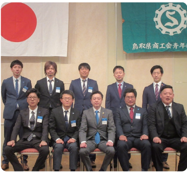
総会にて就任した第21代県青連新役員一同