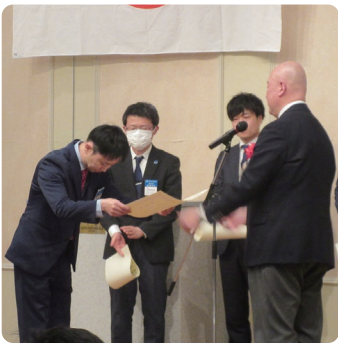
部員増強に係る表彰授与