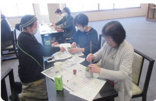
寄せ植えを楽しむ皆さん

さて、前述のとおり、本年度の中国・四国ブロック交流会は本県で開催されます。「ようこそ、ようこそ星取県へ」を大会テーマに、最高のおもてなしで素晴らしい大会となるよう、準備万端でお迎えします!