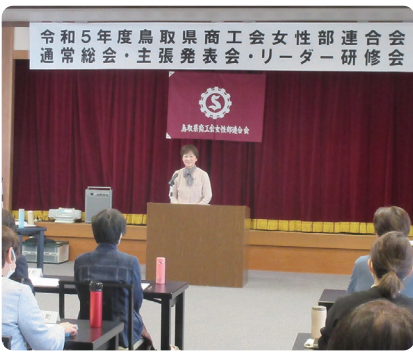
青木県女性連会長の挨拶で開会

また、部員増強運動については、部長同士で有益な情報交換を行いながら、一体感をもって活動していくようという声もあり、今後より一層力を入れて取り組んでいくこととなりました。