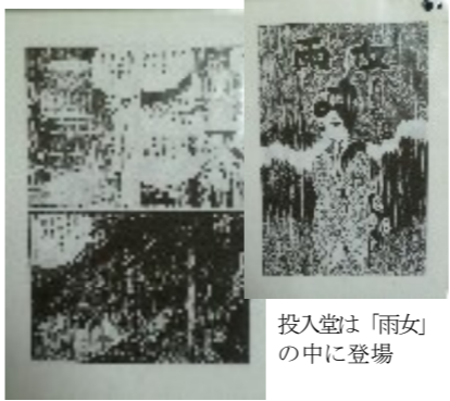
投入堂「雨女」の中に登場