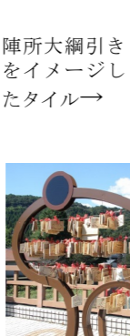
大綱引きのシンボルとして 大綱引きのシンボルとして

台座はヒンズー教のヨニ(女性器)とリンカ(男性器)を表し、足元には大綱引きのシンシヨの男綱と女綱が結ばれる図がタイルで描かれ、中にはハートも隠されている、という具合に三重三重に縁が結ばれる仕掛けになっています。