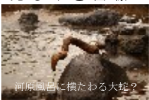
河原風呂に横たわる大蛇？

すぎて使われなかった贅言(ぜいごん)が少しらしい。「陣所」は雌雄の大綱を結合させて引き合い、豊凶を占う行事で、綱は水神である蛇体を表しているといわれる。 それがこの様な姿で河原風呂に引つかかるとは、大綱イコール蛇体を証明したようで、地元の人々も驚いている。