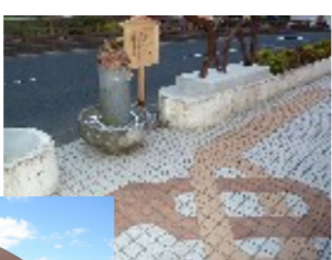
かじか蛙のシンボルとして 縁結びのシンボルとして 縁結びのシンボルとして

映画で一躍脚光を浴びた「恋谷橋」。そのロマンチックな名の橋の中央に「縁結びかじか蛙」があります。 清流に住むかじか蛙は、オスがメスを呼ぶ美しい声で知られ、豊かな自然を守ると共に、縁結びのシンボルとなりました。 そしてその像にはいくつかの秘密が隠されています。