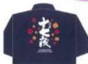
十七夜 ポロシャツ 2024

500年の伝統を誇るふるさとのお祭り「江尾十七夜」。 そのお祭りにあなたのセンスを活かして参加しませんか？ “十七夜ポロシャツ”の素敵なデザインを考えて、 ふるさとを盛り上げましょう!!